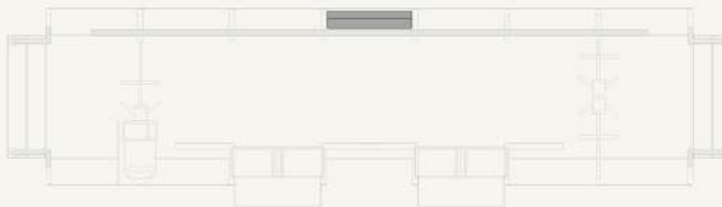
EXPOSITOR DE LIVROS