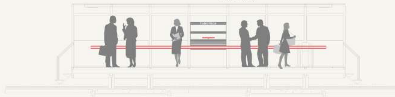
CAIXA COLETORA DE LIVROS